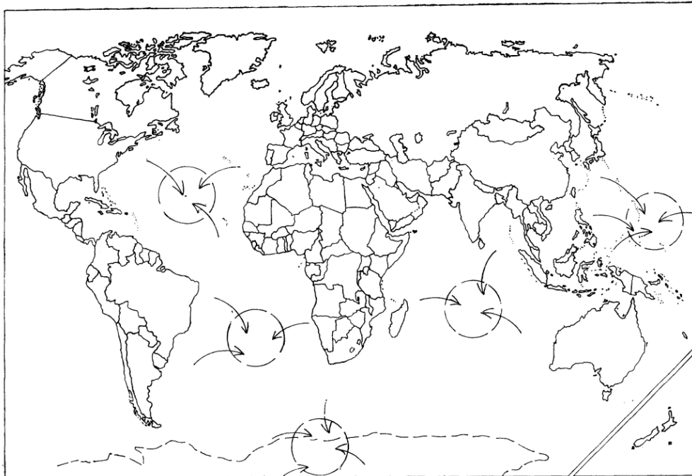
Figura 3- CENTROS OU ÁREAS DE CONVERGÊNCIA DE ESPAÇOS NACIONAIS

Dedicaremos a seguir mais algumas considerações ao centro de convergência do oceano Pacífico uma vez que aí se destacam hoje potencialidades em acelerada formação e em confronto com outras estabelecidas que levam a apontá-lo como congregador certo, em futuro muito próximo, das atenções, cuidados e atitudes de todos os Estados do Globo.