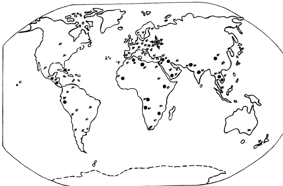
Figura 2- ESQUEMA GERAL DOS PRINCIPAIS PONTOS DE APOIO DO ESPAÇO DA URSS E DA LOCALIZAÇÃO DOS PARTIDOS COMUNISTAS E AFINS

É lógico pensar por tudo isto que o atual espaço Soviético já não apresenta a textura de dois ou três anos atrás e que em futuro muito próximo verá substancialmente reduzidas as suas atuais dimensões.