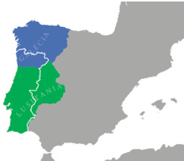
Figura 2-As províncias romanas Lusitânia e Galécia, reorganização da Hispânia de Diocleciano, 298

concedeu o "direito latino" (equiparação aos municípios da Itália) a grande parte dos municípios da Lusitânia. Em 212 a Constituição Antonina atribuiu a cidadania romana a todos os súbditos (livres) do Império e, no fim do século, o imperador Diocleciano fundou a Galécia, que integrava o norte do atual Portugal, a Galiza e as Astúrias, últimos territórios conquistados.