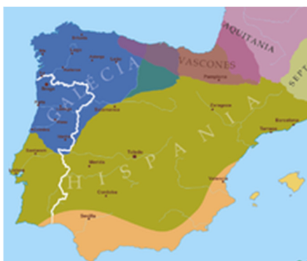
Figura 4-Península Ibérica c. 560: Território suevo com capital em Braga (azul); território visigodo com capital em Toledo (ocre)

Em 415 os visigodos, inicialmente instalados na Gália, avançaram para sul como aliados do Império Romano para expulsar alanos e vândalos, e fundaram um reino com capital em Toledo. A partir de 470 cresceram os conflitos entre o reino suevo e o vizinho reino visigodo. Em 585 o rei visigodo Leovigildo conquistou Braga e anexou a Galécia. A partir daqui toda a Península Ibérica ficou unificada sob o reino visigodo (exceto algumas zonas do litoral sul e levantino, controladas pelo Império Bizantino e a norte pelos vascões). A estabilidade interna do reino foi sempre difícil, pois os visigodos eram uma minoria e professavam o arianismo, enquanto a população local era católica. A sua estratégia inicial foi manter-se como minoria dirigente estritamente separada da maioria autóctone. No entanto a consolidação dos seus reinos deu-se precisamente devido à integração com a população local, adotando a língua latina, adaptando a lei romana e convertendo-se com Recaredo I ao catolicismo, mas em 710 uma crise dinástica entre partidários dos reis Rodrigo e Ágila II levou à invasão muçulmana que resultou no colapso do reino.