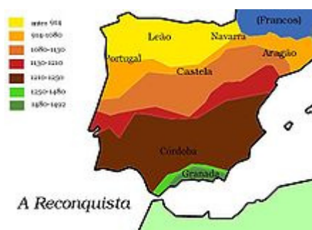
Figura 6-Evolução das fronteiras dos territórios na Península Ibérica entre 914 e 1250

domínios e obter a autonomia aliada à alta nobreza galega contra a sua meia-irmã Urraca de Leão e Castela. Mas em 1121 teve de recuar e negociar um tratado, mantendo-se o condado um vassalo do reino de Leão.