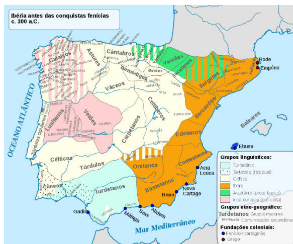
Figura 1-Mapa Étnico-Linguístico da Península Ibérica cerca de 300 a.C.