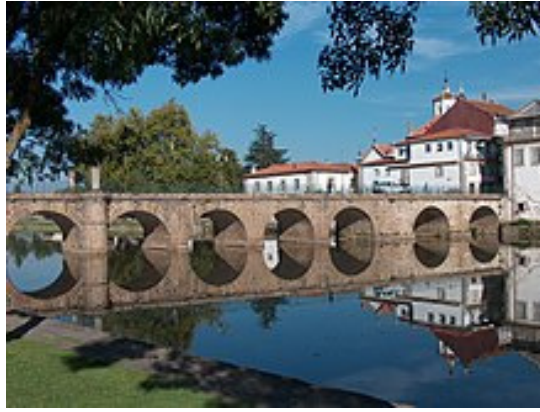
Figura 3-Ponte de Trajano sobre o rio Tâmega, Chaves (Portugal)

A partir do século III o cristianismo difundiu-se em toda a Hispânia.