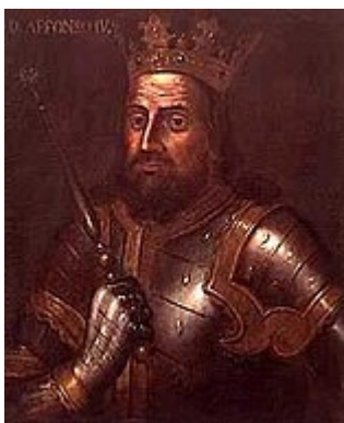
Figura 7-O rei Afonso IV

Foi também um tempo de confusão religiosa causado pelo grande cisma do ocidente. Portugal mudava ora para o papa de Roma, ora para o papa de Avinhão, conforme as alianças. Quando em guerra estava por Roma. Em tempo de paz com Avinhão.