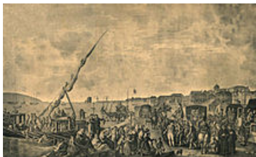
Figura 13-Embarque para o Brasil de D. João VI e de toda a família real, em Belém, em 27 de novembro de 1807. Gravura de Francisco Bartolozzi

A invasão de Portugal foi iniciada ainda nesse ano, pelas tropas do general Junot, reforçadas por três corpos do exército espanhol. Atravessando a Beira Baixa, tomaram Lisboa a 1 de dezembro de 1807. Porém, os planos de Napoleão fracassaram: antes da chegada a Lisboa, toda a corte portuguesa partira para o Brasil, num total de cerca de 15 mil pessoas, ao abrigo de uma convenção secreta com a Inglaterra. Deixaram o território europeu de Portugal nas mãos de uma regência, com instruções para não "resistir" aos invasores. Ficava vazio de conteúdo o decreto de Napoleão banindo a Casa de Bragança do trono de Portugal. A partir do Rio de Janeiro a corte prosseguiu a política internacional portuguesa e D. João VI mandou invadir a Guiana Francesa e a Cisplatina (Uruguai), como retaliação.