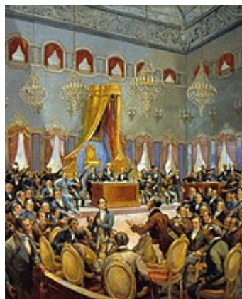
Figura 14-As Cortes Constituintes de 1822 que aprovaram a primeira Constituição, por Oscar Pereira da Silva

Nesse ano as Cortes aprovaram a Constituição portuguesa de 1822, que o rei aceitou, iniciando a monarquia constitucional. Inspirada na Constituição francesa de 1791 e na Constituição Espanhola de 1812, consagrava a divisão tripartida dos poderes (legislativo, executivo e judicial), limitava o papel do rei a uma mera função simbólica, colocando o poder no governo e num parlamento unicameral eleito por sufrágio direto. Isso mostrava a forte influência iluminista.