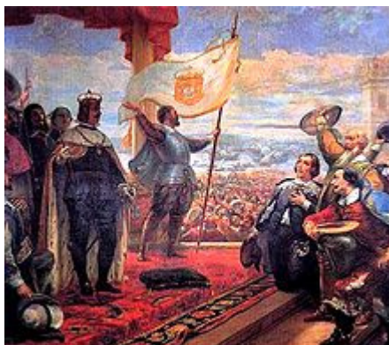
Figura 12-Aclamação de D. João IV como rei de Portugal, pintado por Veloso Salgado, Museu Militar de Lisboa

recuperaram o Recife e conseguiram reconquistar Angola e São Tomé. Em 1661 foi selada a segunda Paz de Haia. Portugal aceitou as perdas na Ásia e os holandeses a soberania portuguesa do Nordeste brasileiro, mediante o pagamento equivalente a 63 toneladas de ouro. Nesse ano, para obter uma aliança com os ingleses, D. João IV negociou o casamento da sua filha Catarina de Bragança com Carlos II de Inglaterra, cedendo como dote Tânger e Bombaim.