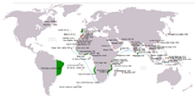
Figura 10-Descobrimientos portugueses de 1415-1543, principais rotas no Oceano Índico (azul), territórios portugueses no reinado de D. João III (verde)

Em 1542 ou 1543, comerciantes portugueses aportam no Japão, onde mais tarde ajudam a fundar Nagasáqui. Em 1557, as autoridades chinesas autorizaram os portugueses a estabelecerem-se em Macau, que se tornou a base de um próspero comércio triangular entre a China, o Japão e a Europa, via Malaca e Goa. Em 1571, uma cadeia de entrepostos ligava Lisboa a Nagasaki: nascera o primeiro império global da história, trazendo enormes riquezas para Portugal.