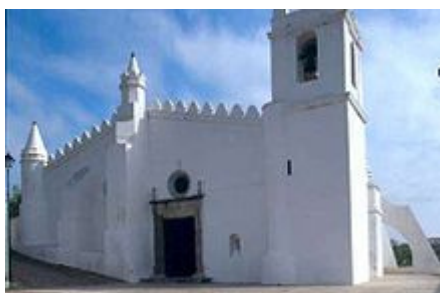
Figura 5-Antiga mesquita de Mértola, no sul de Portugal, hoje Igreja de Nossa Senhora da Anunciação

As populações locais puderam permanecer nas suas terras mediante pagamento. Os seus hábitos, cristãos e judeus foram tolerados. Apesar de arabizados, os moçárabes mantiveram um contínuo de dialetos românicos — a língua moçárabe — e rituais cristãos. Os novos ocupantes desenvolveram a agricultura, melhorando os sistemas de rega romanos, introduzindo a cultura de arroz e de citrinos, alperces e pêssegos. As novas técnicas de regadio permitiram a existência da pequena propriedade, como as hortas.