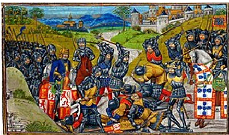
Figura 8-A Batalha de Aljubarrota que assegurou a independência face a Castela, a nova dinastia de Avis e a Aliança Luso-Britânica. Pintura do século XV de Jean d'Wavrin, British Library

Com aliados ingleses, D. João I liderou uma vitória determinante na batalha de Aljubarrota, que aniquilou definitivamente o exército castelhano e assegurou a independência do reino. Os exércitos portugueses foram comandados por Nuno Álvares Pereira, nomeado Condestável do Reino. Meses depois, o Condestável invadiu Castela e infligiu nova derrota na Batalha de Valverde. O casamento de D. João I com D. Filipa de Lencastre, princesa inglesa filha de João de Gante, e a assinatura do Tratado de Windsor (1386) selaram a Aliança Luso-Britânica.