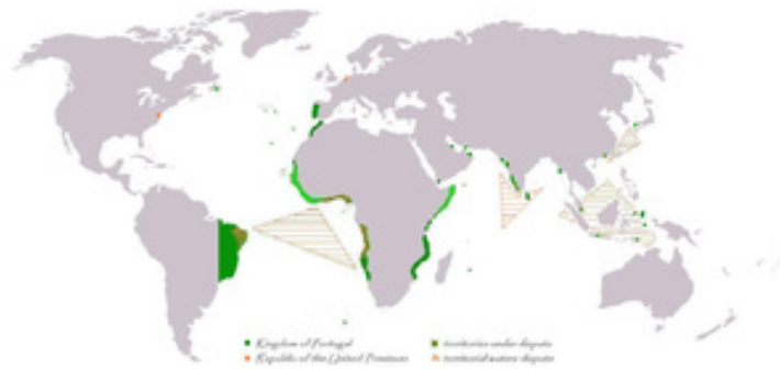
Figura 11- Império português (verde) com as zonas disputadas entre 1588-1654 pelos holandeses das companhias da República das Sete Províncias Unidas (laranja)