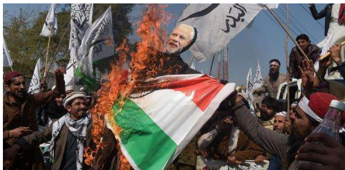
Figura 9 – Protestos Indianos contra o Paquistão

A insuficiência hídrica também é causa de instabilidade regional, e essa mesma instabilidade poderá levar a queda total de governos, guerra civil e poderá mesmo causar um impacto multinacional, numa espécie de bola de neve.