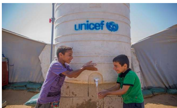
Figura 11 – Abastecimento de água

que em 15 de março de 2011, desse início á guerra civil, conflito esse que ainda se encontra no ativo, que deslocou mais de 12 milhões de pessoas e custou a vida a mais de 400 mil pessoas, com estimativas por parte do Observatório Sírio para os Direitos Humanos (S.O.H.R.)a contabilizar perto de 600 mil pessoas mortas por este conflito.Com o conflito ainda a decorrer, não só há pouca água, como o desperdício causado pela destruição e más infra-estruturas leva a que, segundo dados do Escritório das Nações Unidas para a Coordenação de Assuntos Humanitários,15.5 milhões de sírios não tenham acesso a água potável.