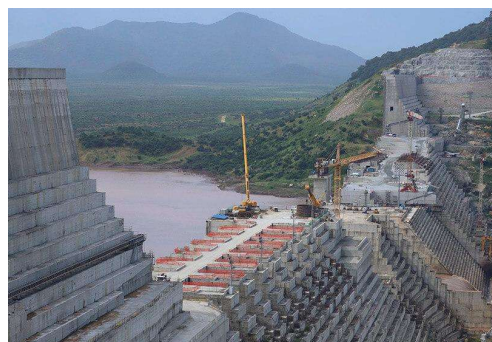
Figura 8 - Grand Ethiopian Renaissance Dam

O Egito é um dos 9 países que são banhados pelo rio Nilo, e que se encontra em conflito político com vários dos países banhados pelo Nilo, sendo os principais o Sudão e a Etiópia. A Etiópia pretende construir a “Grand Ethiopian Renaissance Dam”, barragem essa que irá ser a maior de África. A barragem encontra-se a 45km da fronteira com Sudão, e fica no Nilo Azul, um dos rios que compõe mais tarde o Nilo. É importante ter em consideração que, apesar do Nilo Azul ser o Nilo com menor distância, em comparação ao Nilo Branco, é responsável por cerca de 70% do caudal do Nilo. Com a construção da barragem 70% da água fica comprometida devido á capacidade de mais de 60 milhões de litros cúbicos. Com uma capacidade de produção de 6.35 gigawatts, sendo suficiente para abastecer a Etiópia e torna-la num hub energético devido ao alto saldo energético positivo. Isto torna a exportação de energia possível, não só criando crescimento económico na Etiópia, como também reduzindo a deficiência energética presente nos seus países vizinhos, como por exemplo o Sudão.