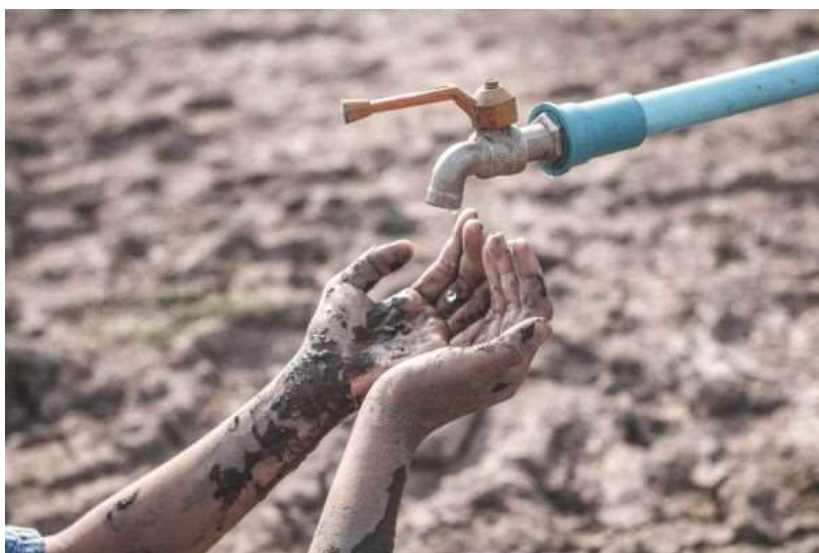
Figura 12 – Escassez de água

É crucial, promover a cooperação, democracia, o diálogo e a sustentabilidade de forma a poder lutar contra as alterações climática ser esquadrar o recurso precioso que é a água. É fundamental criar organizações e alianças como a OMVS (Organization pour la Mise en Valeur du fleuve Sénégal) que é composta pelos países banhados pelo rio Senegal e que tem o propósito de administrar, através da cooperação e interajuda a água desse mesmo rio de maneira a satisfazer a necessidade de todos os seus membros democraticamente.