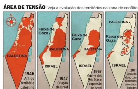
Figura 1 (ver em anexo 1)

O conflito entre o Israel e a Palestina localiza-se no Oriente Médio, surgiu por volta do ano de 1947 e iniciou-se com o facto da ONU ter aprovado a divisão da Palestina em um Estado judeu e outro árabe. Um ano depois, Israel é proclamado país e isto fez com que os palestinos tenham ficado sem Estado.