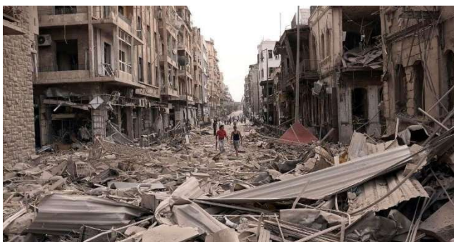
Figura 10 – Guerra Civil na Síria

Estudos apontam que apesar de não ser a única, a seca que fustigou a Síria durante 5 anos (2006/11) foi um dos principais fatores que levou a guerra civil, que perdura até hoje. A seca extrema na Síria levou, segundo dados das Nações Unidas, a uma falha geral de grande parte do sistema agrário, e com ele 3/4 das explorações a falharem e a uma queda ainda maior da pecuária, com a consequente morte de cerca de 85% de todo o gado. Devido a estes fatores, um grande movimento de êxodo rural aconteceu. Juntando a escassez de alimento se indisponibilidade hídrica, ao êxodo rural, a crise económica, a primavera árabe, o surgimento de movimentos extremistas (Isis) e outros fatores como tensões geopolíticas internacionais levou a