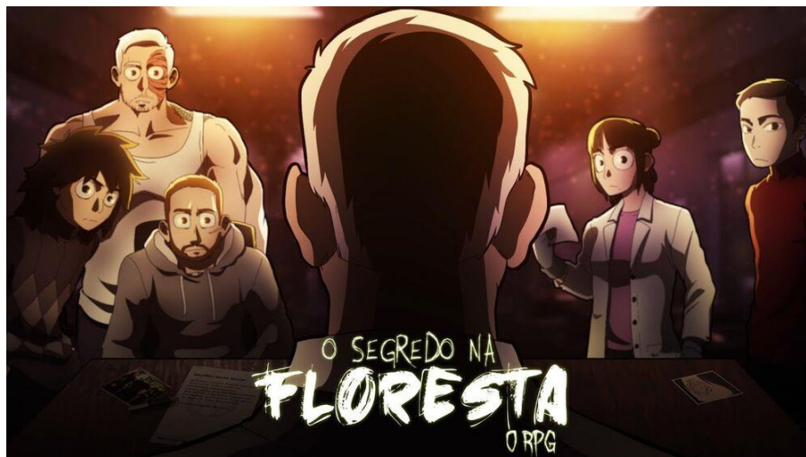
Figura 2 - Segunda Campanha

a Ordem envia seus agentes para uma cidade isolada e pacata, no interior do Rio Grande do Sul, chamada Carpazinha. Na região, a recém formada equipe se depara com um vilarejo (chamado de Santo Berço) criado por um grupo ocultista de cientistas, que utilizava a energia dos próprios habitantes para alimentar um "Santo" em troca da vida em uma "cidade perfeita".