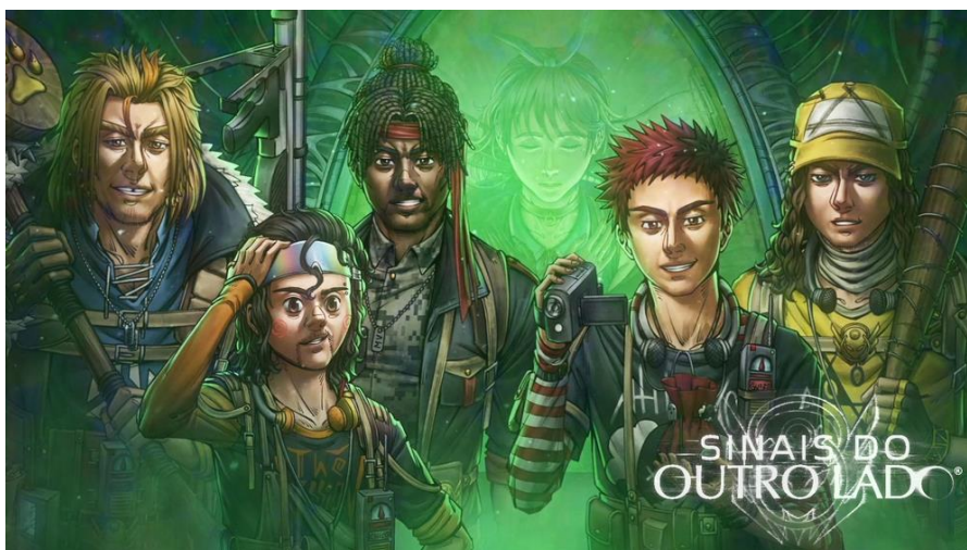
Figura 6 - Sexta Campanha