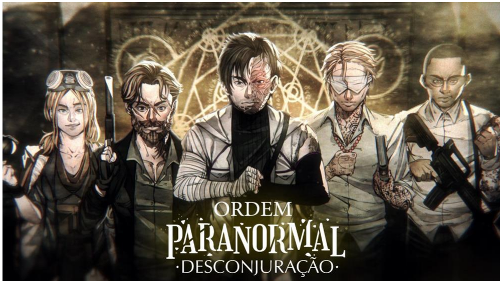
Figura 3 - Terceira Campanha