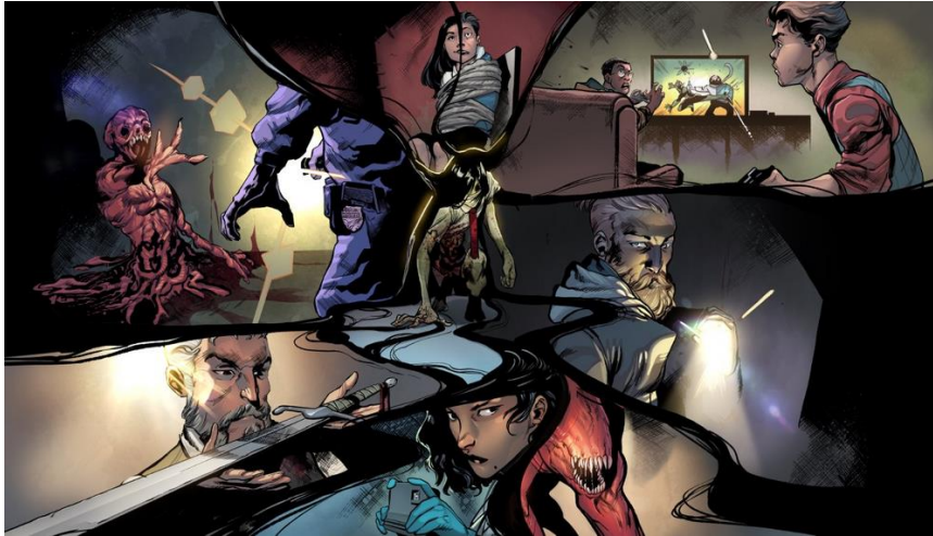
Figura 1 - Primeira Campanha