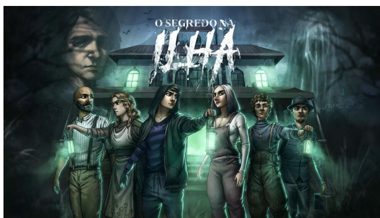
Figura 5 – Quinta Campanha

A quinta campanha foi anunciada durante um evento especial realizado em live no dia 18 de junho de 2022. Usando como base o próprio sistema de Ordem Paranormal RPG, Cellbit introduz uma nova história com personagens novos, ainda tendo ligação com Calamidade, mas podendo ser acompanhada sem precisar assistir as outras. No dia 25 de junho de 2022, Gabi Cattuzzo e Rakin, veteranos da série, se juntam a Beamom, Cinemagrath e Goularte para desvendar os mistérios do desaparecimento de um pintor dentro de uma mansão em uma ilha isolada.