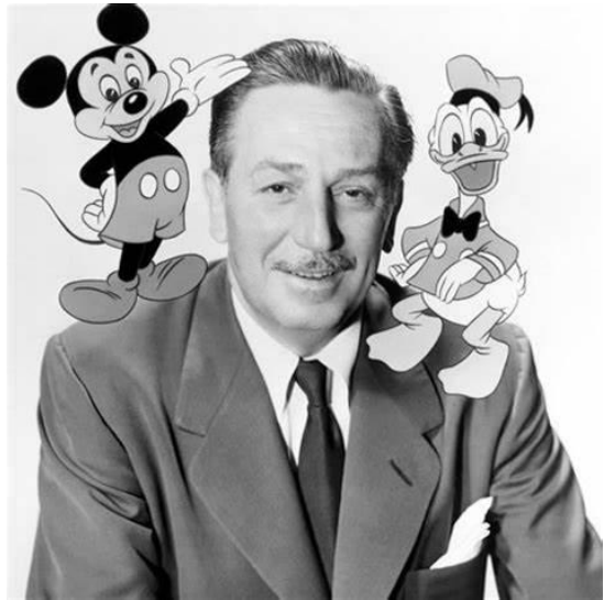
Figura 1 - Walt Disney

Nos anos seguintes, a Disney expandiu as suas operações, produzindo uma série de curtas-metragens e filmes de animação. Em 1937, eles lançaram a primeira longa-metragem de animação, "Branca de Neve e os Sete Anões", que foi um enorme sucesso.