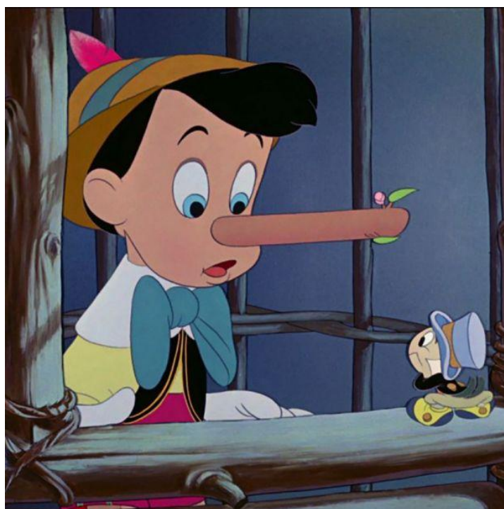
Figura 4- Pinóquio

"Pinóquio" recebeu aclamação da crítica pela sua animação impressionante, personagens cativantes e mensagens intemporais sobre a importância da honestidade e do altruísmo. Embora não tenha sido um sucesso comercial imediato na época do seu lançamento, o filme desde então tornou-se num clássico da animação.