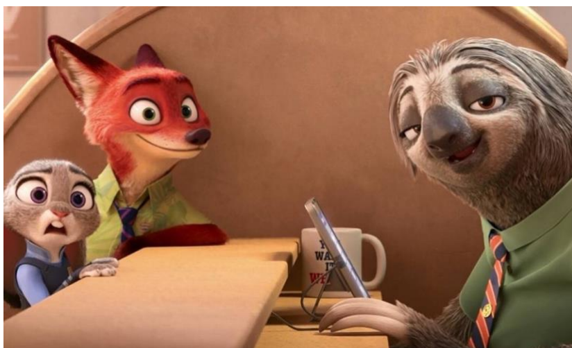
Figura 31- Zootopia

Judy enfrenta desafios ao ingressar na força policial, onde é subestimada e designada para trabalhos menores. Determinada a provar seu valor, ela se envolve em uma