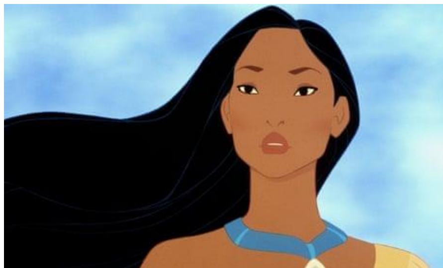
Figura 19- A Pocahontas

O filme passa-se na colónia inglesa de Jamestown, no Novo Mundo, durante o século XVII. Os colonos ingleses, liderados pelo Capitão John Smith, estão em busca de ouro e