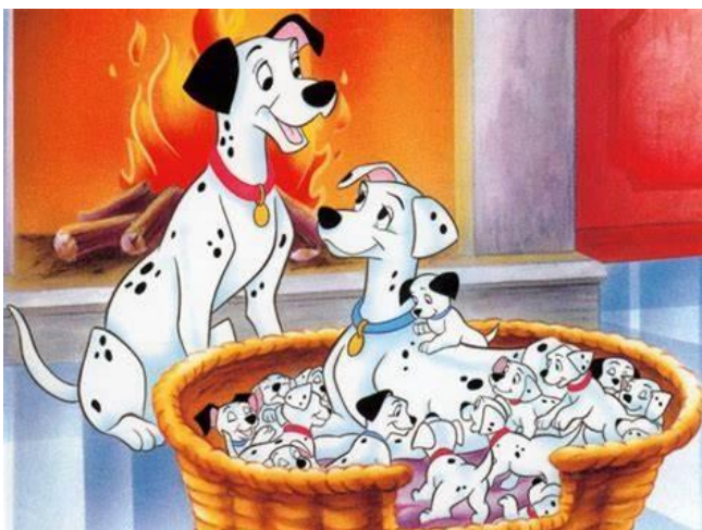
Figura 12- 101 dálmatas

"101 Dálmatas" é um clássico filme de animação da Disney lançado em 1961, baseado no romance de mesmo nome de Dodie Smith.