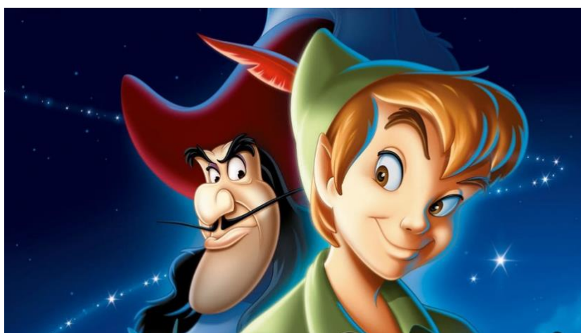
Figura 9- Peter e o Capitão Gancho

"Peter Pan" é conhecido pela sua animação encantadora, personagens memoráveis e mensagens sobre a importância da infância, imaginação e amizade. Continua a ser um filme amado por gerações, lembrando-nos da magia e aventura que residem dentro de todos nós.