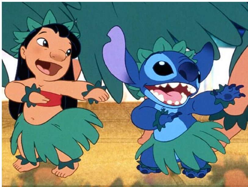
Figura 24- Lilo e Stitch

Enquanto isso, Lilo está passando por dificuldades em sua vida após a morte de seus pais. Sua irmã mais velha, Nani, está lutando para criar e cuidar dela. Determinada a provar que é capaz de cuidar de um