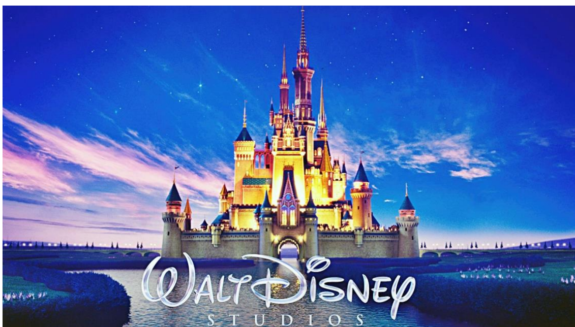
Figura 33- Logotipo da Walt Disney

Em conclusão, a Disney continua a ser uma força dominante na indústria cinematográfica, proporcionando entretenimento cativante e inspirador para públicos de todas as idades ao redor do mundo. Através de sua capacidade de contar histórias atemporais, criar personagens memoráveis e oferecer mundos de fantasia envolventes, a Disney transcende gerações e fronteiras culturais. Seus filmes não apenas entretêm, mas também ensinam importantes lições de moral, coragem e amizade. A diversidade de sua filmografia, que abrange desde clássicos animados até adaptações live-action e filmes inovadores da Pixar, demonstra a habilidade da Disney de se adaptar e evoluir ao longo do tempo. Além disso, a empresa tem um impacto significativo na cultura popular e no imaginário coletivo, moldando as experiências de muitas pessoas ao redor do globo. Em suma, a Disney e seus filmes continuam a encantar, inspirar e conectar pessoas de todas as idades, deixando um legado duradouro no mundo do entretenimento.