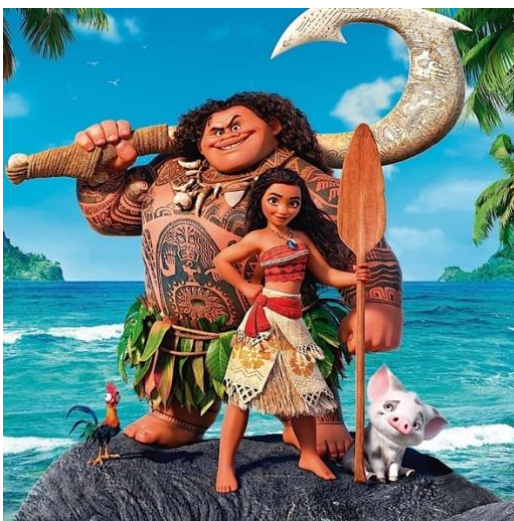
Figura 32- Moana e Maui

No clímax do filme, Moana enfrenta a deusa Te Kā, que representa a manifestação da maldição, e restaura o coração de Te Fiti, trazendo vida de volta ao oceano e às ilhas. Moana retorna à sua ilha como uma heroína e futura líder, inspirando sua tribo a explorar o oceano além das barreiras de seu recife.