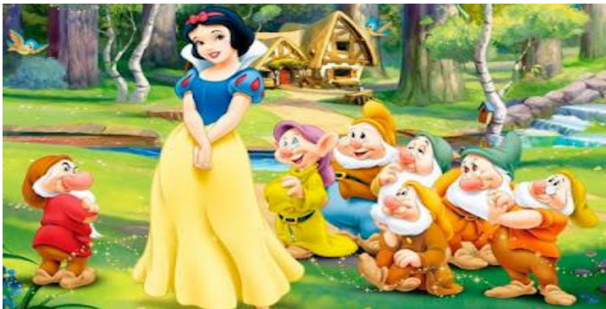
Figura 3-Branca de Neve e os sete anões

"Branca de Neve e os Sete Anões" estabeleceu o padrão para os futuros filmes de animação da Disney e consolidou o estúdio como líder na indústria de animação