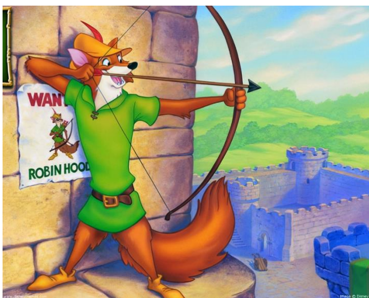
Figura 15- Robin-Hood

No filme, Robin Hood é retratado como um habilidoso arqueiro que rouba dos ricos e dá aos pobres, enquanto desafia o corrupto Príncipe João e o malvado Xerife de Nottingham.