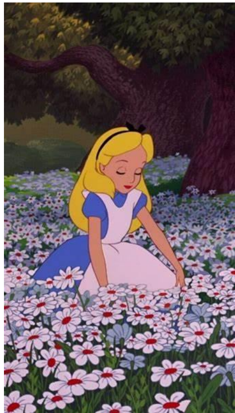
Figura 8- Alice no país das maravilhas

No final, Alice acorda para descobrir que tudo não passou de um sonho, mas as suas aventuras no País das Maravilhas deixam uma marca duradoura na sua imaginação e na dos espectadores.