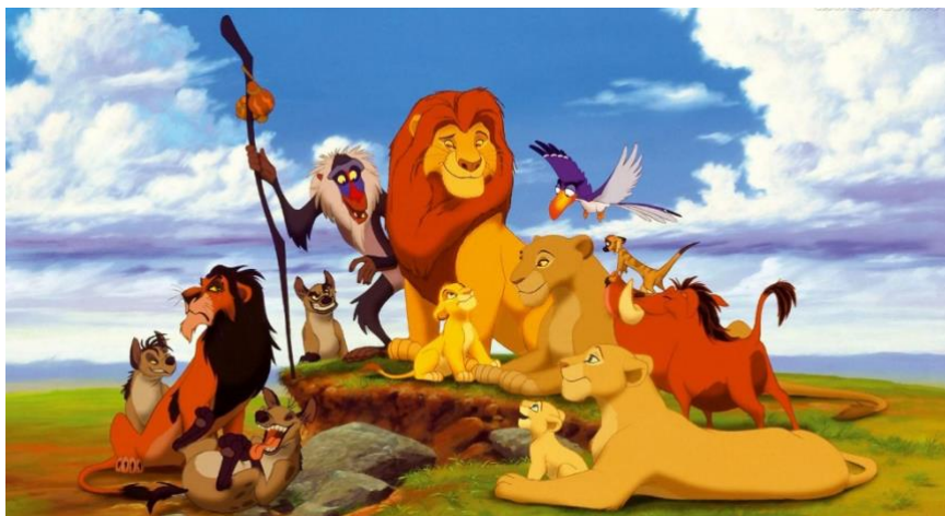
Figura 18- O rei leão

No entanto, o tio de Simba, Scar, tem inveja do trono e planeja usurpar o poder. Ele elabora um plano para matar Mufasa e culpar Simba pelo seu assassinato. Scar consegue forjar um acidente que resulta na