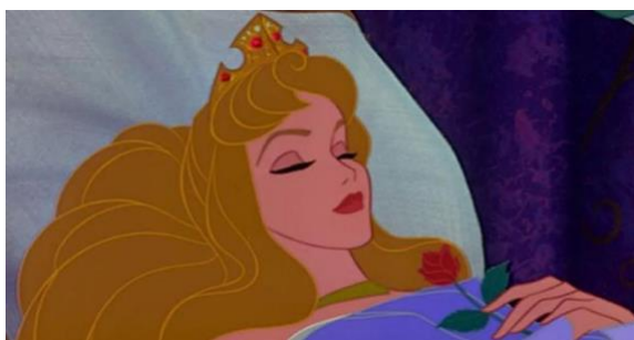
Figura 11- A bela adormecida

No final, a princesa Aurora é acordada, o reino celebra sua libertação da maldição, e ela e o príncipe Filipe são unidos em casamento, selando o seu amor e trazendo alegria para o reino.