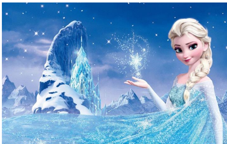
Figura 30- Frozen

"Frozen" é elogiado por sua animação deslumbrante, trilha sonora cativante (incluindo a música "Let It Go") e mensagens positivas sobre amor, autoaceitação e o poder do vínculo entre irmãs. O filme se tornou um fenômeno cultural e é amado por pessoas de todas as idades em todo o mundo.