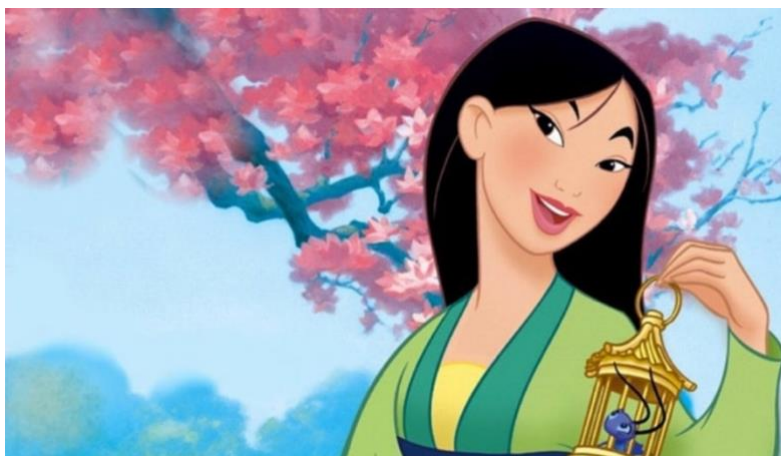
Figura 22- A Mulan

O filme se passa na China durante a Dinastia Han. Mulan é uma jovem determinada e corajosa que vive em uma sociedade patriarcal que valoriza os homens