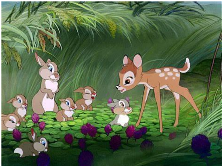
Figura 6- Bambi

"Bambi" foi um sucesso crítico e comercial na época do seu lançamento e continua a ser considerado um dos maiores filmes de animação de todos os tempos. A sua influência pode ser vista em muitas produções posteriores da Disney e permanece como um filme amado por