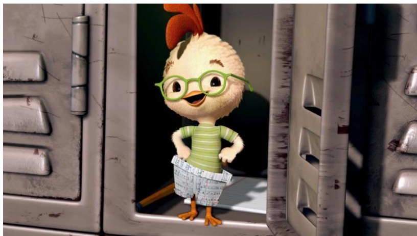
Figura 25- Chicken Little

A cidade inicialmente duvida de Chicken Little mais uma vez, mas à medida que os alienígenas começam a atacar, eles percebem que ele estava falando a verdade. Com a ajuda de seus amigos, Chicken Little lidera a luta contra os invasores e finalmente ganha o respeito de sua cidade.