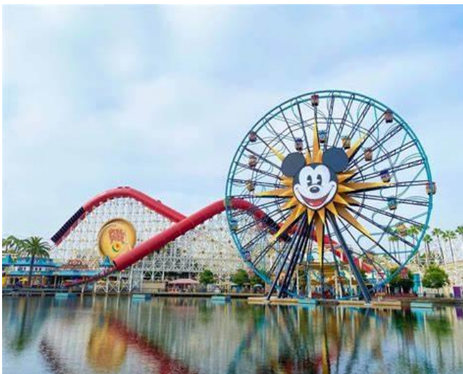
Figura 2- Disneyland

Em 1955, a Disney inaugurou o seu primeiro parque temático, a Disneyland, na Califórnia. Este foi o primeiro de muitos parques temáticos da Disney ao redor do mundo, incluindo o Walt Disney World Resort na Flórida, que foi aberto em 1971, e muitos outros em todo o mundo.