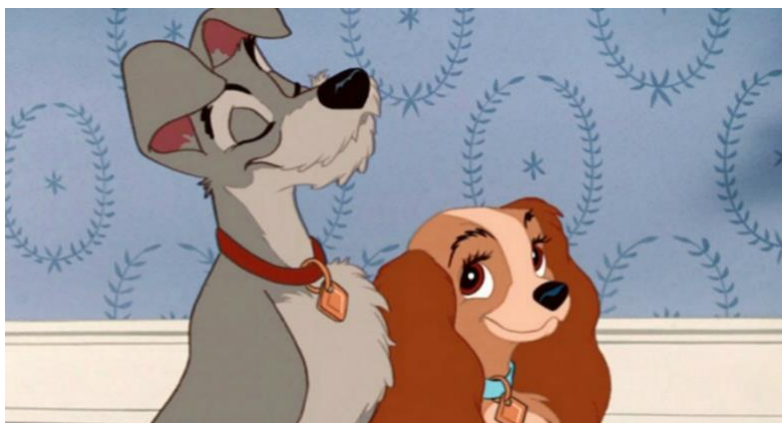
Figura 10- A Dama e o vagabundo

"A Dama e o Vagabundo" é um conto clássico sobre amor, aventura e a importância da família, e continua a encantar espectadores de todas as idades até hoje.