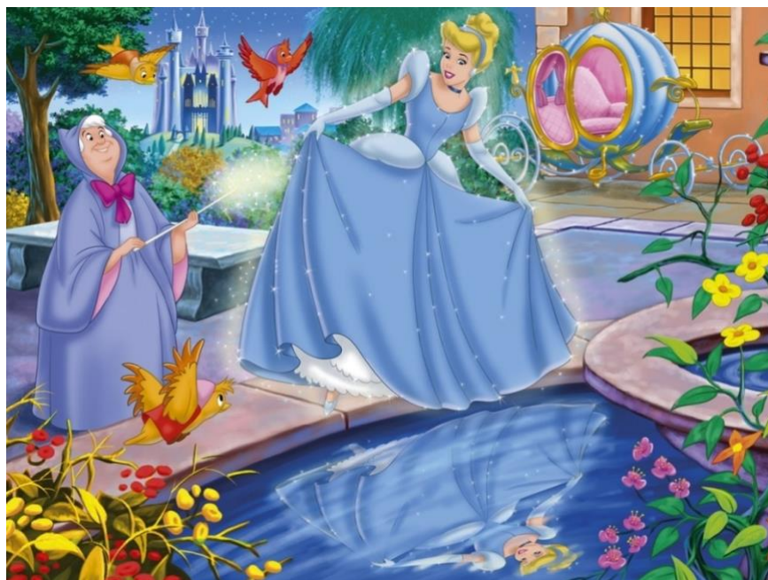
Figura 7- Cinderela

A sorte de Cinderela muda quando ela recebe a visita de sua fada madrinha, que a transforma para que ela possa comparecer ao baile real. Lá, Cinderela encanta o príncipe com sua beleza e graça, mas ela precisa de voltar antes da meia-noite, quando o feitiço da fada madrinha acaba.