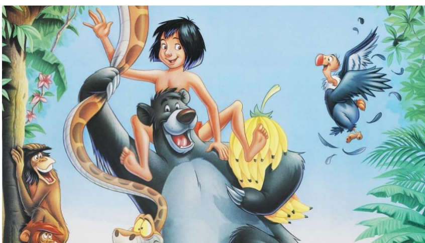
Figura 13- Mogli e os animais

No entanto, no caminho, Mogli se separa de Baguera e encontra Baloo, um urso preguiçoso e amigável. Baloo concorda em cuidar de Mogli e ensiná-lo sobre a Lei da