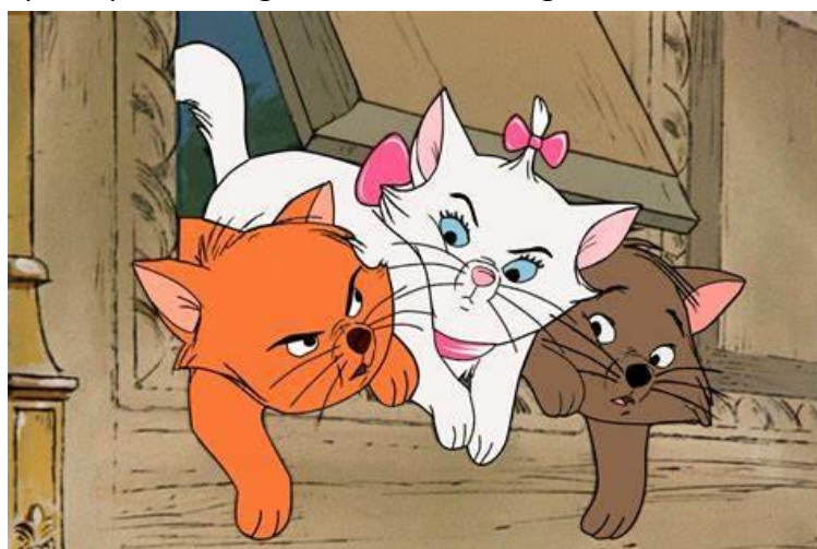
Figura 14- As aristogatas

"Aristogatas" é uma história encantadora sobre família, amizade e superação de desafios, e continua a ser amada por crianças e adultos por sua animação cativante e personagens adoráveis.