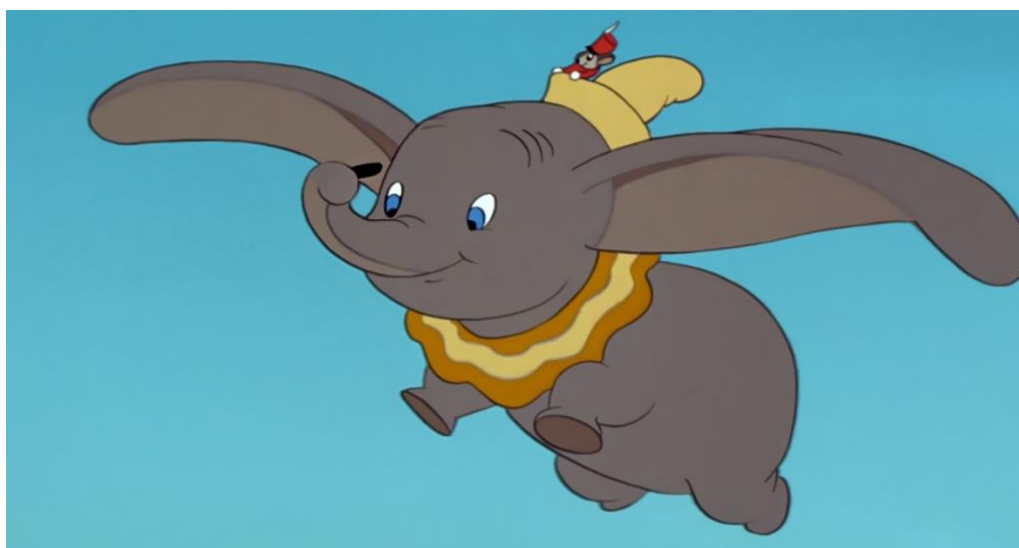
Figura 5- Dumbo

"Dumbo" foi produzido com um orçamento modesto devido às dificuldades financeiras enfrentadas pelo estúdio na época. No entanto, o filme foi bem recebido pelo público e pela crítica, especialmente pela sua animação expressiva e pelas mensagens emocionantes que transmite. Ao longo dos anos, "Dumbo" tornou-se um dos clássicos mais aclamados da Disney e continua a encantar crianças e adultos com a sua história comovente e personagens cativantes.