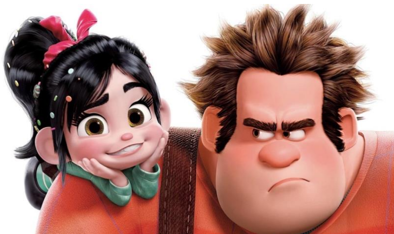
Figura 29- Ralph e Candy

"Força Ralph" é elogiado por sua animação criativa, personagens cativantes e mensagens positivas sobre autoaceitação, amizade e redenção. O filme é uma homenagem à cultura dos videogames e é apreciado por fãs de todas as idades.