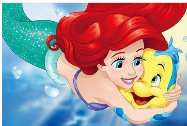
Figura 16- A pequena sereia

Um dia, Ariel salva o príncipe Eric de um naufrágio e se apaixona por ele. Determinada a se tornar humana para ficar ao lado de Eric, Ariel faz um acordo com Ursula, uma bruxa do mar, que promete transformá-la em humana em troca de sua voz.