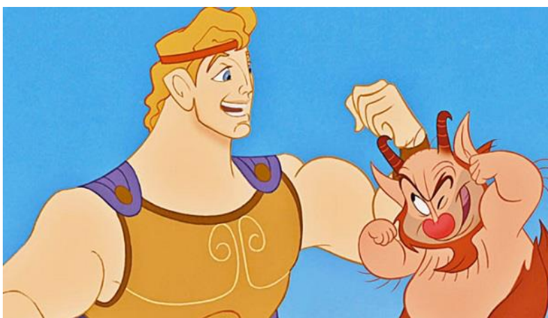
Figura 21- Hércules

"Hércules" é conhecido por sua animação vibrante, humor irreverente e trilha sonora cativante, que inclui músicas como "Go the Distance" e "Zero to Hero". O filme oferece uma visão única da mitologia grega e continua a ser amado por seu charme e energia até hoje.