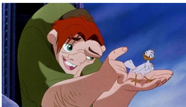
Figura 20- Corcunda de Notre Dame

O filme se passa na Paris do século XV e gira em torno de Quasímodo, um homem deformado que vive no campanário da Catedral de Notre Dame e é criado pelo cruel juiz Claude Frollo. Quasímodo é tratado como um pária pela sociedade devido à sua aparência.