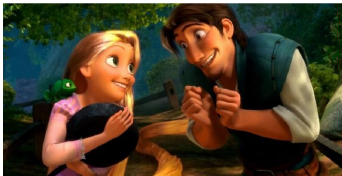
Figura 28- Rapunzel e Flynn

"Entrelaçados" é elogiado pela sua animação deslumbrante, personagens carismáticos e uma trilha sonora cativante. O filme é uma reinvenção encantadora da clássica história de Rapunzel, com um toque moderno e emocionante.