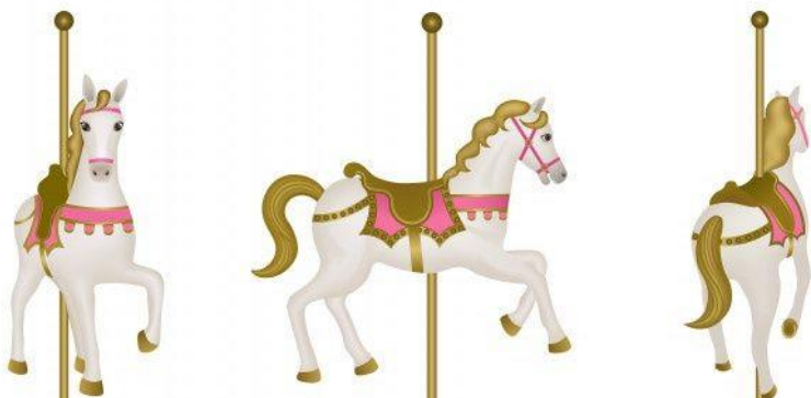
Figura 19-cavaleiro de carrossel

Não seria bem uma flor, mas quase. Parecia mesmo uma flor. Só um cavaleiro especial, um cavaleiro raro, pode assim mostrar uma flor no focinho e tantas estrelas azuis pelo corpo todo.