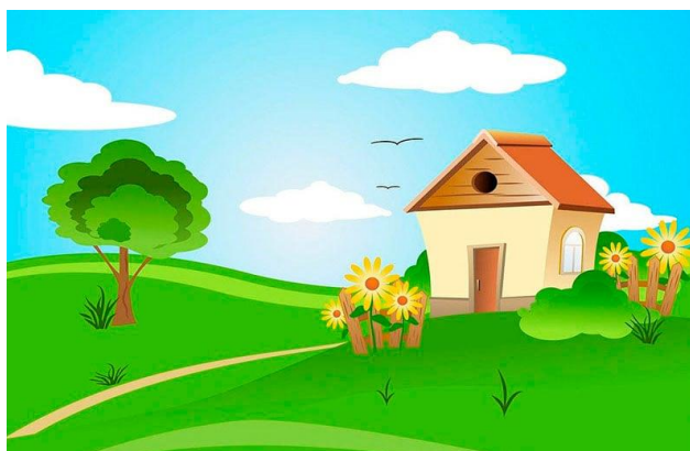
Figura 18-casa de madeira

“Se não encontrar hoje a casa do texugo, cavo um buraco fundo na neve”, pensou ela, “e assim não fico gelada...”