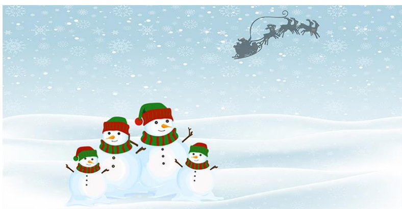
Figura 10-bonecos de neve

– Claro que somos, Mãe Natal. Explica-nos então o que temos de fazer para dar alegria a esses meninos.