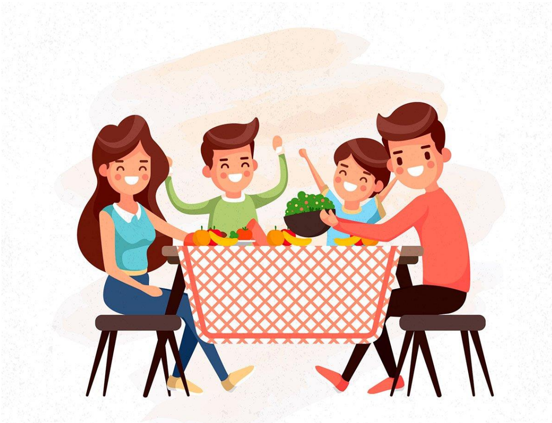
Figura 11-família à mesa