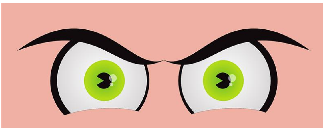
Figura 21-olhos zangados

Quando estou zangado bato o pé... Mas isso não me faz grande bem.