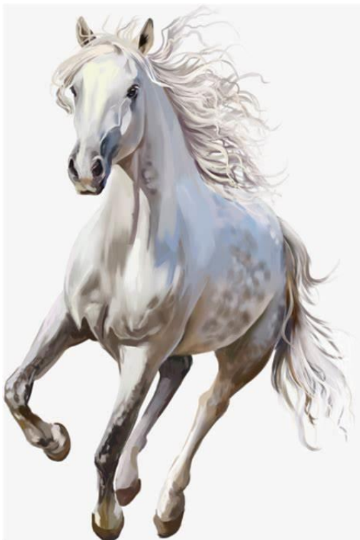
Figura 20-cavalo branco

— Por causa das tonturas — explicou ele.